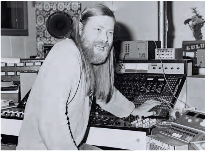
Conny Plank im Studio