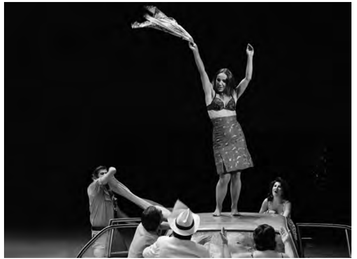
Mythos Carmen